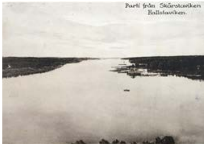
Edeboviken med dubbelfel. Edeboviken har blivit Skärstaviken och Hallstavik står som Hallstaviken.

1912 köper Holmens Bruk ångsågen och Skebokajen samt mycket skog och mark av Skebo bruk. Holmens bygger ett