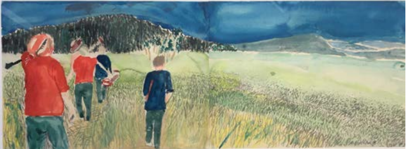
De gick över myren.