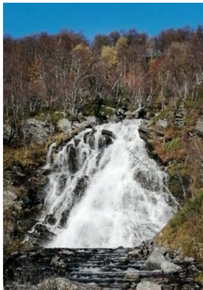
Anderssjöfallet med en fallhöjd på över 70 meter.