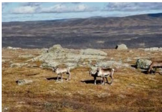
Ett möte med renar på Svanåkläppen.

Tännaldalens område är en del av Funäsfjällen. Det är även en ort belägen på en höjd av cirka 720 meter över havet, nära norska gränsen. Totalt finns tio markerade leder i området.