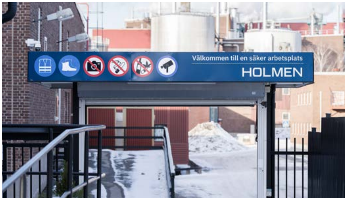
Nya skyltar vid fabriksentréerna som informerar om de gällande reglerna.