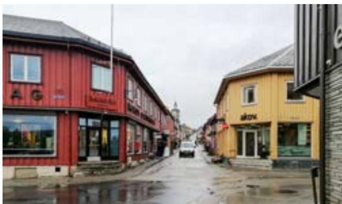
Ett besök i Norge och Røros passade bra en regning dag.