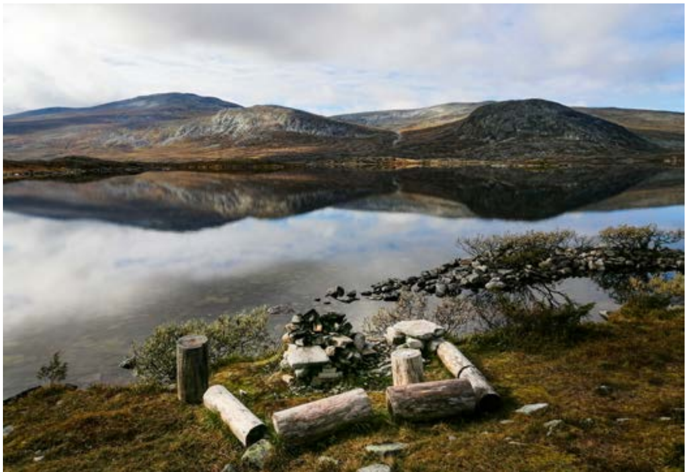
Grillplats vid sjön Bolagen nedanför Bolagsstugan.