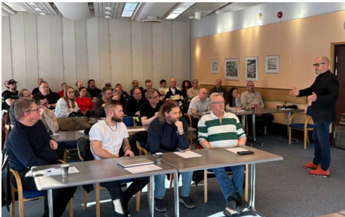
Pappers, Kommunals och Byggnads förtroendevalda i samtal med LO-ordföranden

I slutet på 2024 beslutade avdelningsstyrelsen att framöver slå ihop kontakt- och skyddsombudsträffen. Den 14 februari var det dags att testa den nya modellen. Mötet var delat i tre olika pass – aktuella förhandlingsfrågor, tematimmar och skyddsverksamhet.