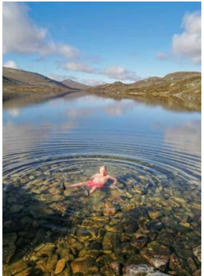
Vacker plats, vackert väder, dags för bad! Här var det 11 grader i vattnet. Norges bergsmassiv ses i bakgrunden.