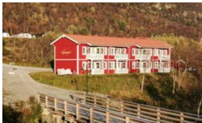
Vår lägenhet Mosippan högst upp till vänster.