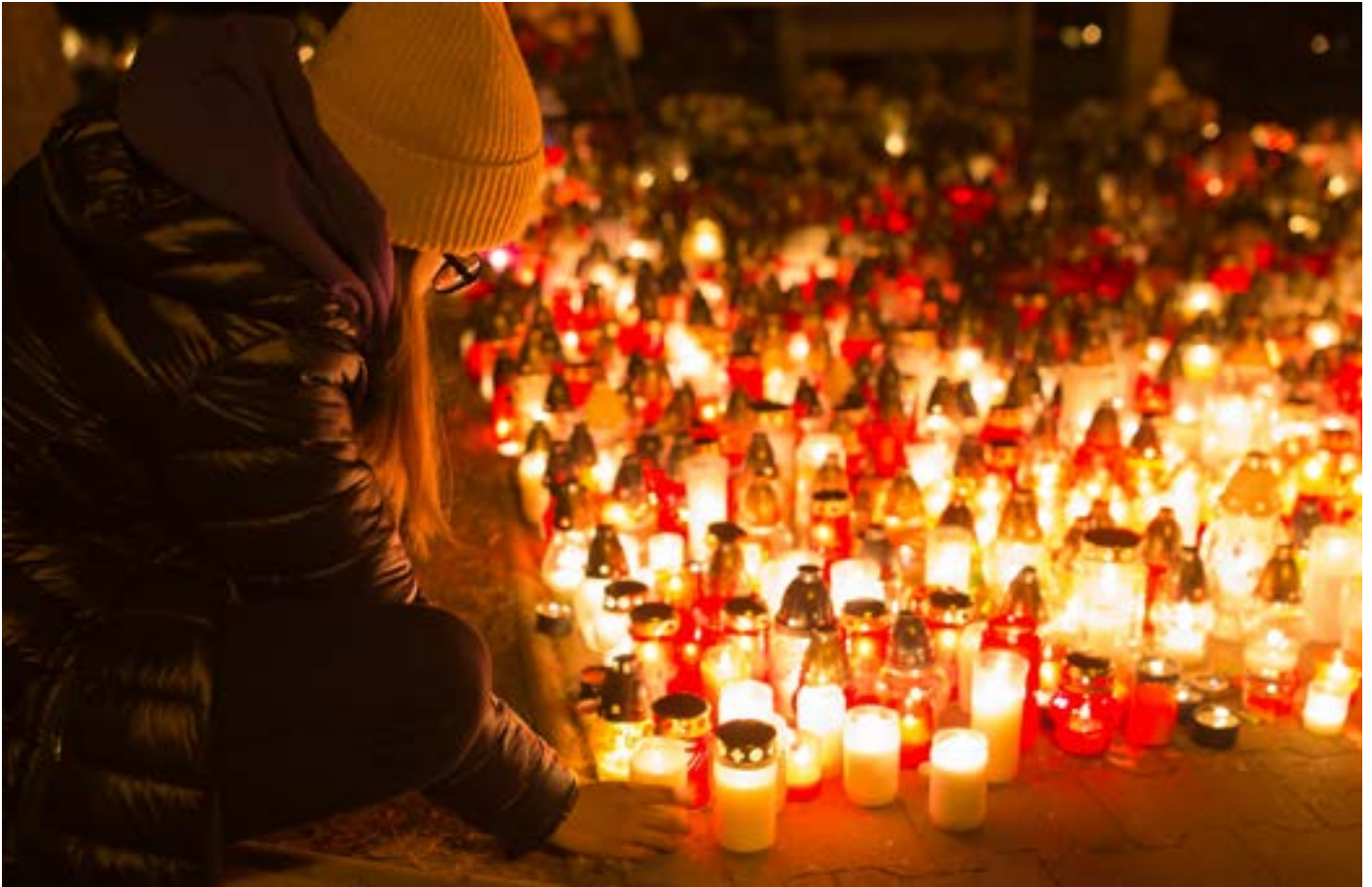
Skolmördaren levde i ett mycket specifikt politiskt sammanhang som heter Sverige 2025