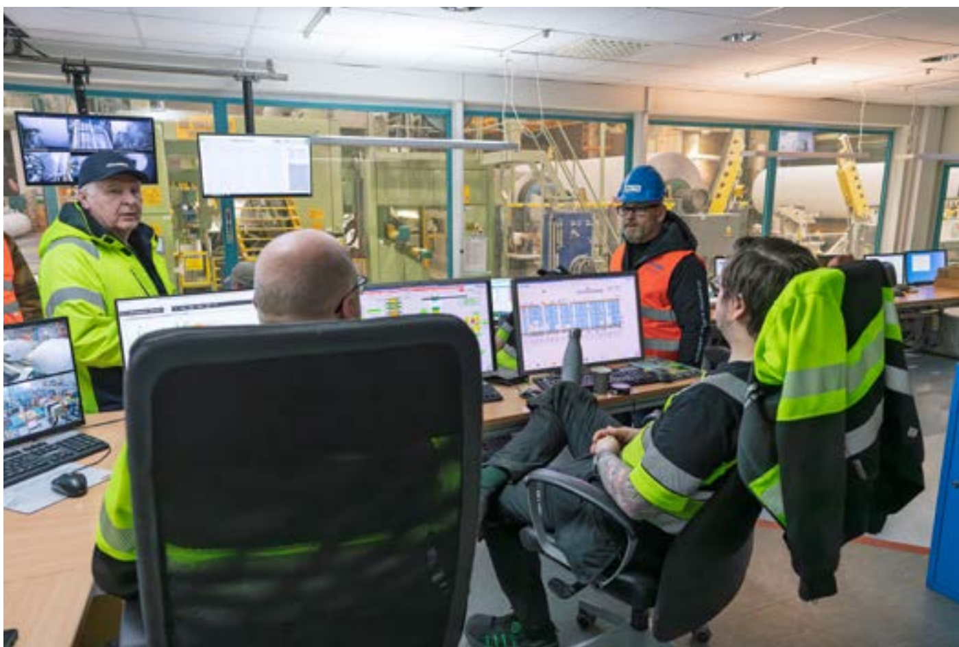
Samtal i PM12:s manöverrum.