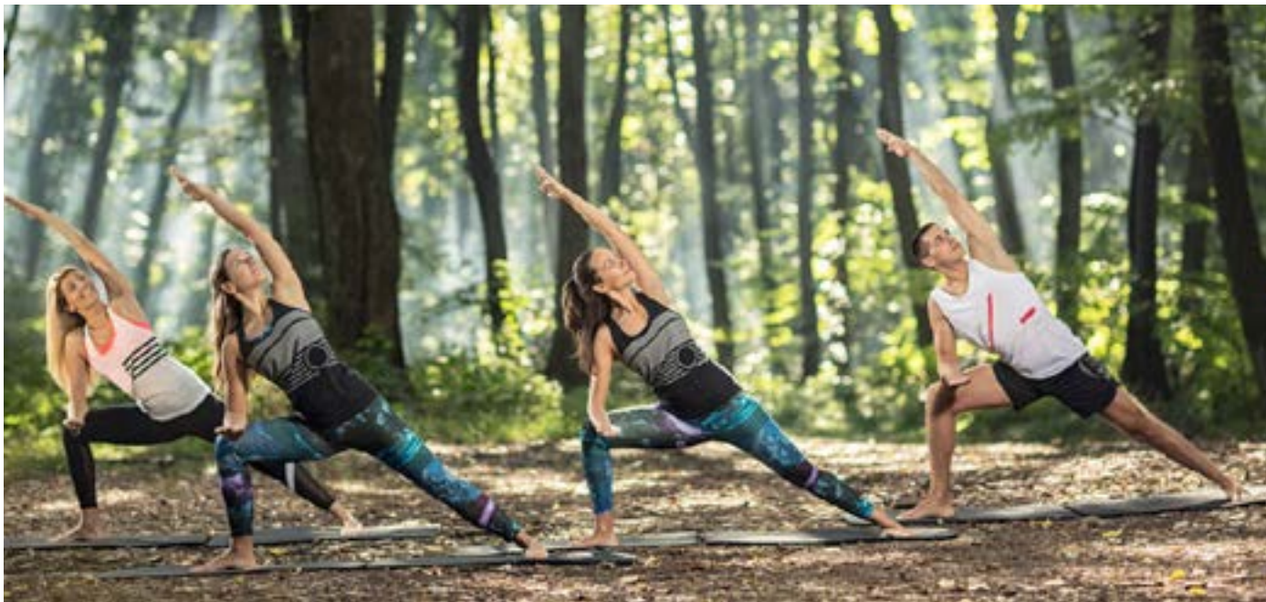
Fysisk aktivitet har blivit viktigare än någonsin.