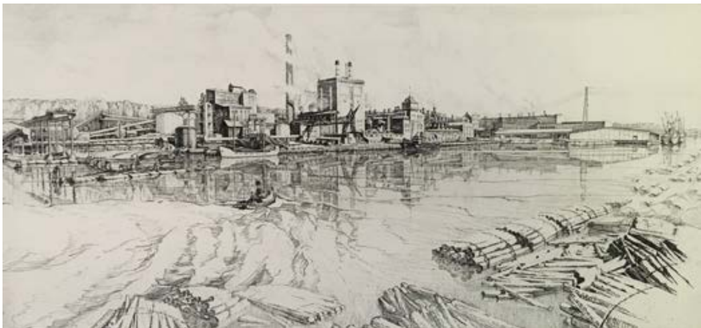
Christian Due Hallsta pappersbruk etsning