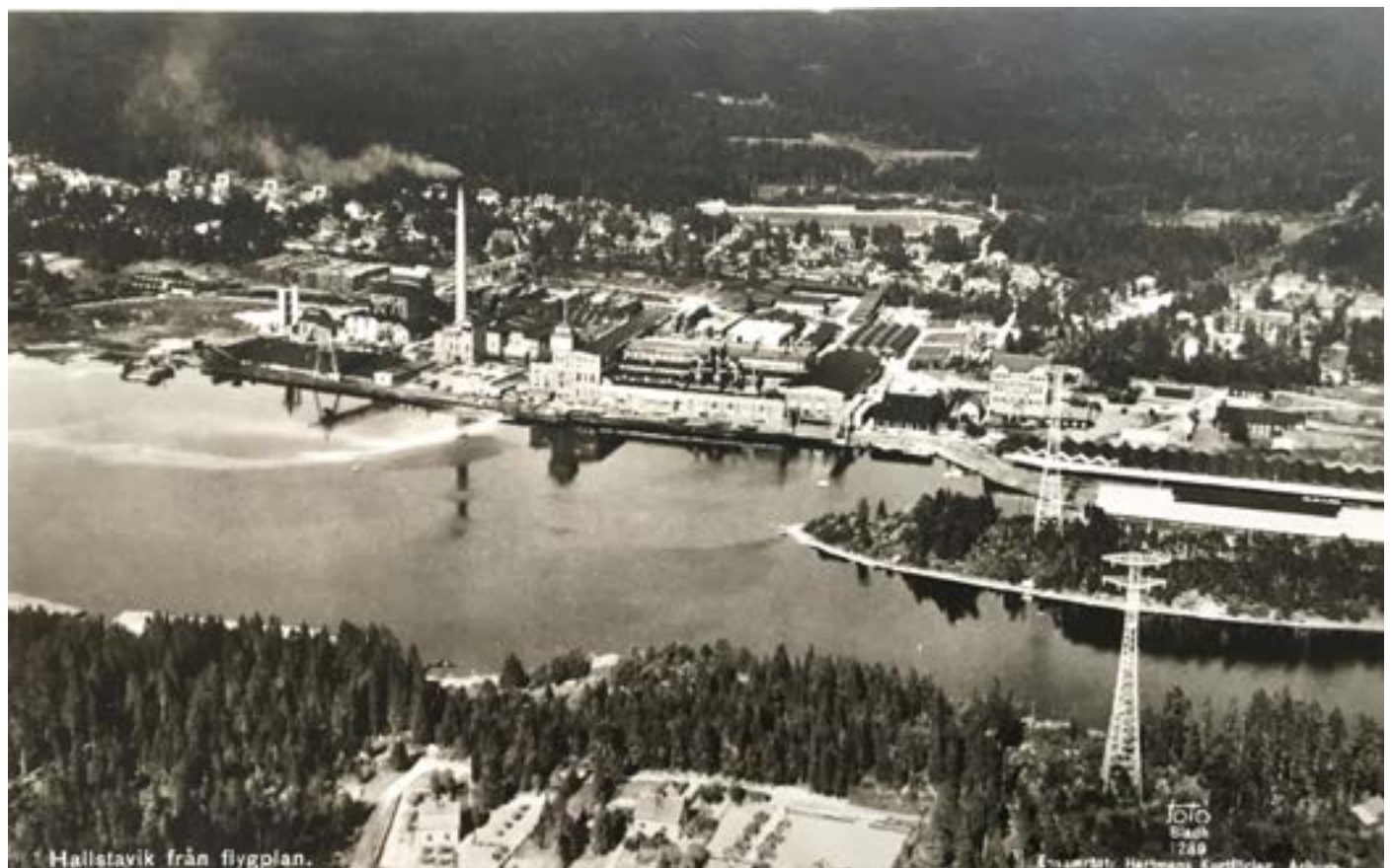
Bruket vid Edeboviken. Kangelholmen till höger gör passagen trång in till den innersta delen av viken.