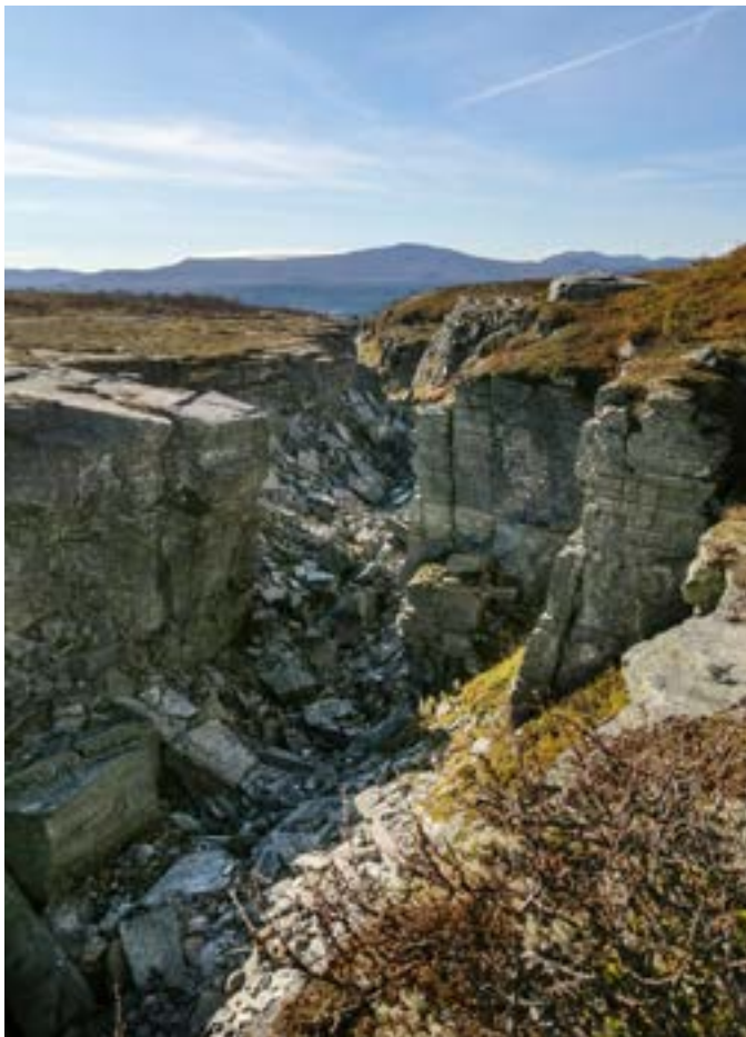
Evagraven, en kanjon skapad av smältisen under den senaste istiden. En spännande plats för att begrunda naturens krafter.