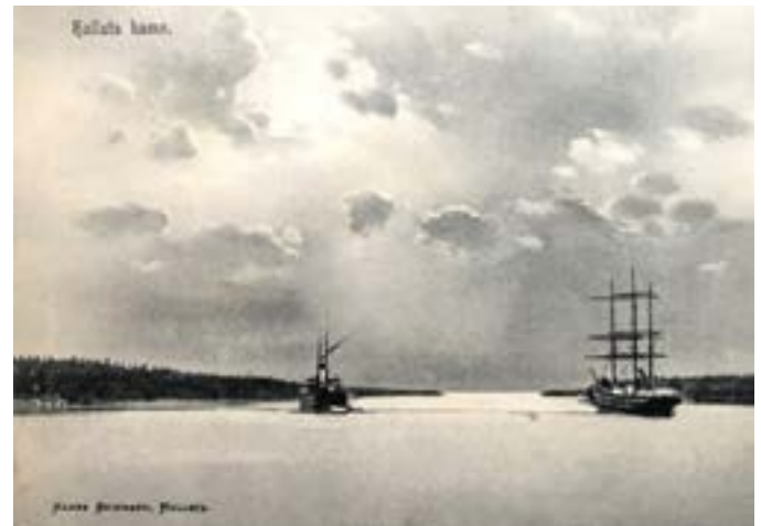
På segelfartygens tid.