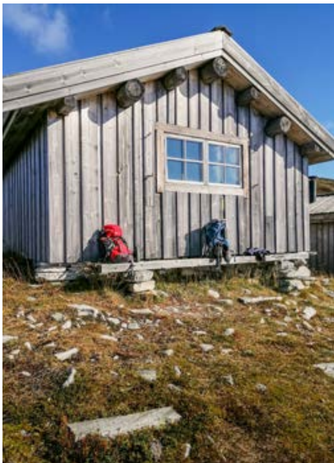
Bolagsstugan i Fjällnäs, en fin plats för en paus.