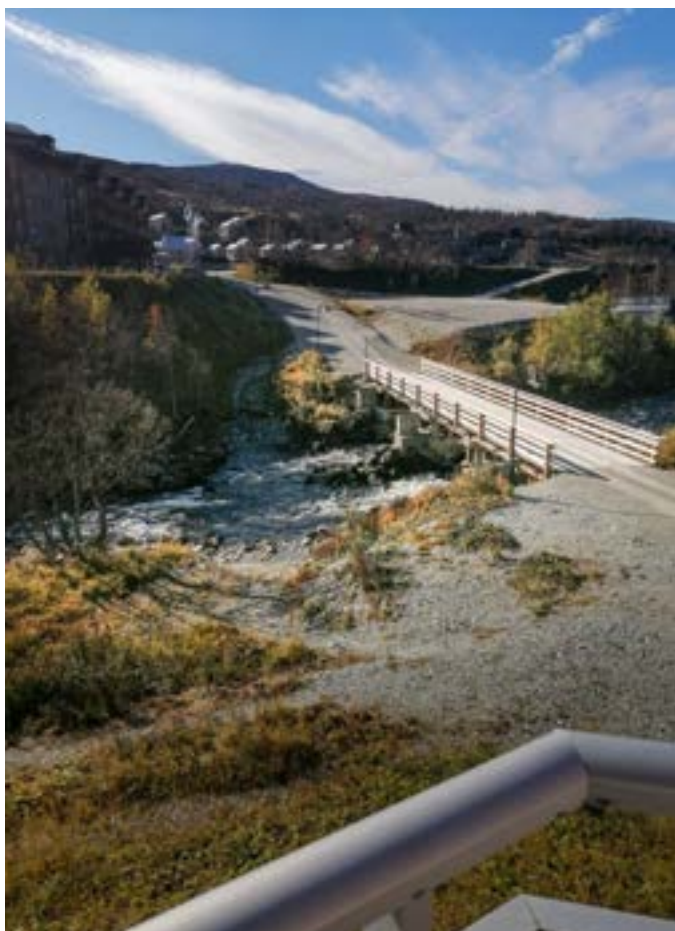
Utsikt från vår balkong. Tännån brusade utanför och här hittade jag en av mina badplatser.