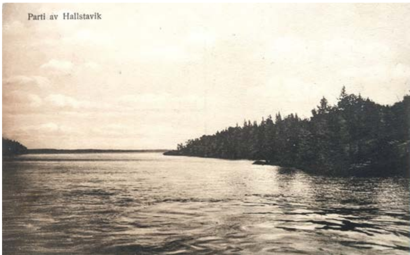
En båttur på Edeboviken har blivit vykort