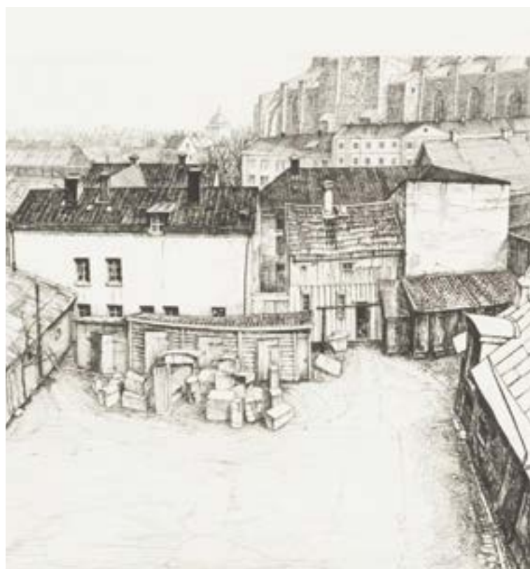
Bakgård, Uppsala 1957 etsning Utgiven av Folket i Bilds konstklubb, nu på Moderna Museet.