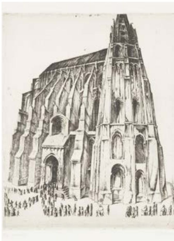
Katedral I etsning 1957. För ovanligheten finns människor med på bilden.