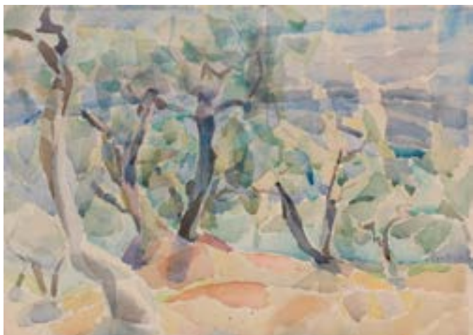
Trädkronor akvarell 1963 tillhör Moderna Museet.